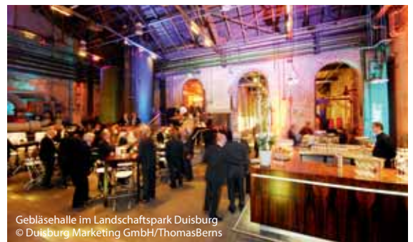
Gebäldehalle im Landschaftspark Duisburg