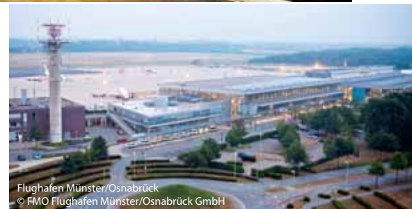
Flughafen Münster/Osnabrück